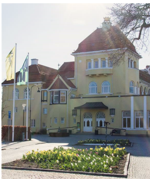
Figur 3 Restaurangpaviljongen idag.

År 1985 genomfördes en större renovering av byggnaden som då var i dåligt skick. Efter ytterligare några år som restaurang, och sedan som kårhus, flyttade Casino Cosmopol in 2001. Kasinot stängde 2024.