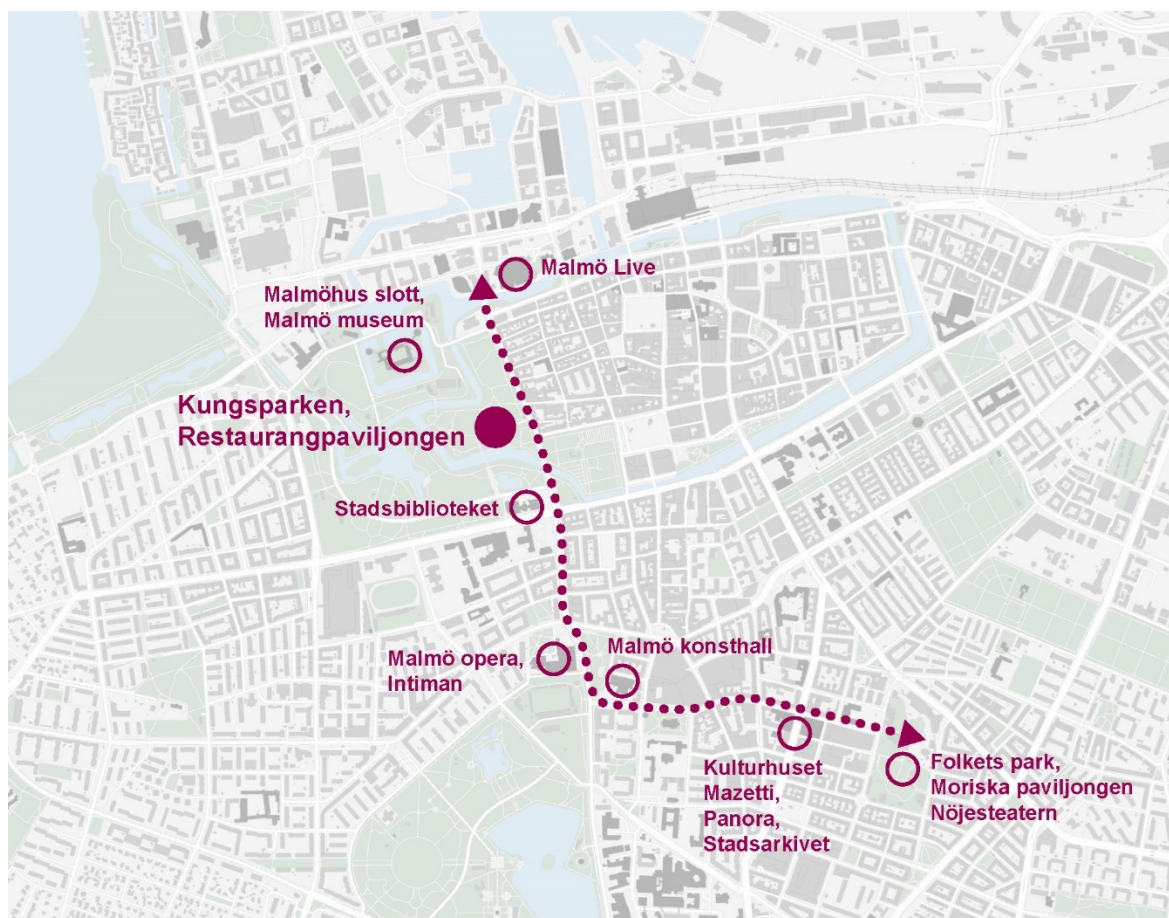
Figur 4 Karta över kulturstråket som sträcker sig från Malmöhus slott och Malmö Live till Folkets park.

Placeringen i Kungsparken ger Malmös konstsamling ett sammanhang som stärker både samlingen och platsens identitet. Malmös Konstmuseum kommer bli en naturlig del av kulturella stråket i centrala Malmö, med närhet till etablerade mötesplatser som Malmö Opera, Konsthallen, Malmö Museum, Stadsbiblioteket och Malmö Live. Kungsparken har redan idag stora flöden av cyklister och gångtrafikanter samt ligger nära flera kollektivtrafiknoder.