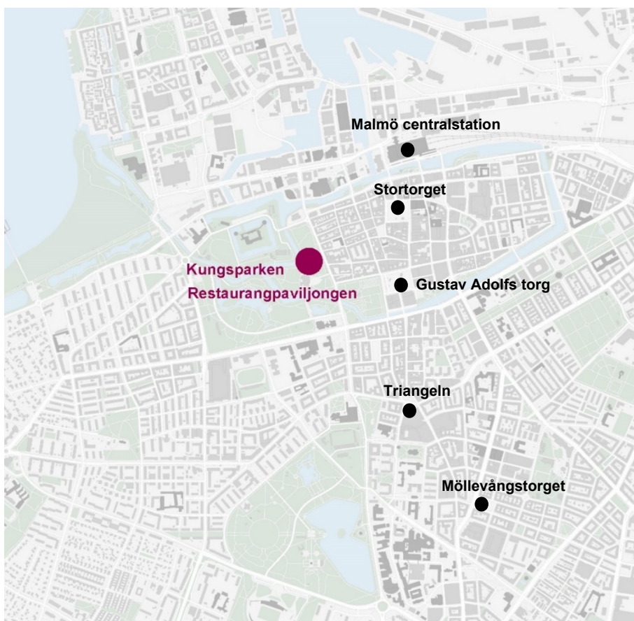
Figur 1 Karta som visar Kungsparken och Restaurangpaviljongens placering i centrala Malmö.

noga uttänkta siktlinjer mot utvalda konstverk, exotiska träd och blomsterutsmyckningar. Förebilderna kom från kontinenten, där det i parken syns inslag som grotta med vattenkälla och en fontän från Paris. Parkbesökarna promenerade på slingrande gångar intill ståtliga, exotiska träd och rumsbildande vintergröna buskpartier.